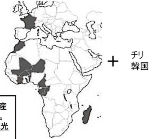
定期航空協会作成資料より引用