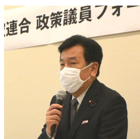
枝野 幸男(衆) フォーラム会長