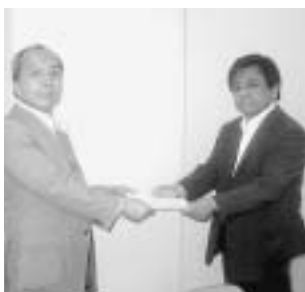
◀ 辻村理事長への要請