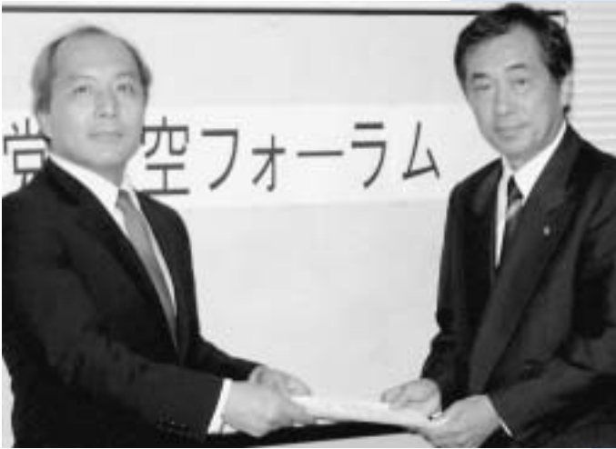
▲ 民主党 菅直人ネクスト国土交通大臣への要請

航 空連合は、6月中旬から7月上旬を中心に、今年も全国で「政策実現総行動」を展開しました。全体政策としては、総合的な安全体制の確立や首都圏空港容量の早期拡大などを重点要求に掲げ、民主党、自民党、国土交通省、財務省、定期航空協会、JAL・ANA経営に対し要請を行いました。