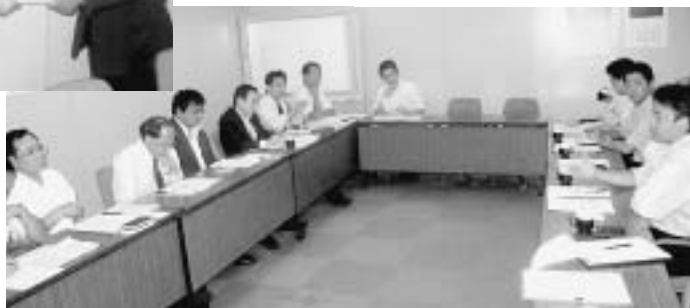
▼ 定期航空協会との意見交換