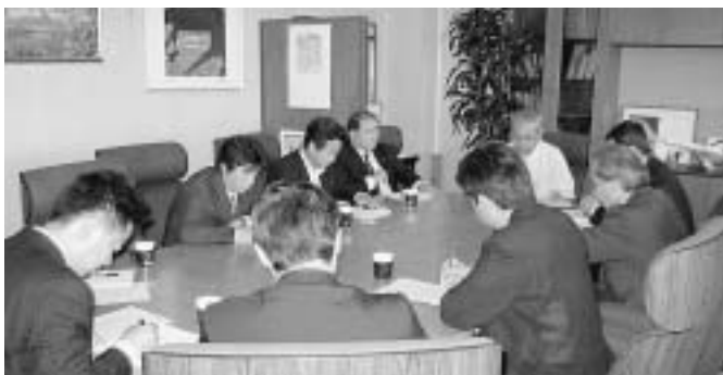
▲航空局との意見交換