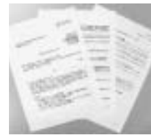
各要請先からの 回答文書