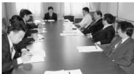
◀ 主税局との意見交換