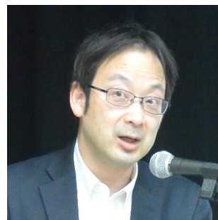
大野 達 国土交通省 航空局 航空ネットワーク部長