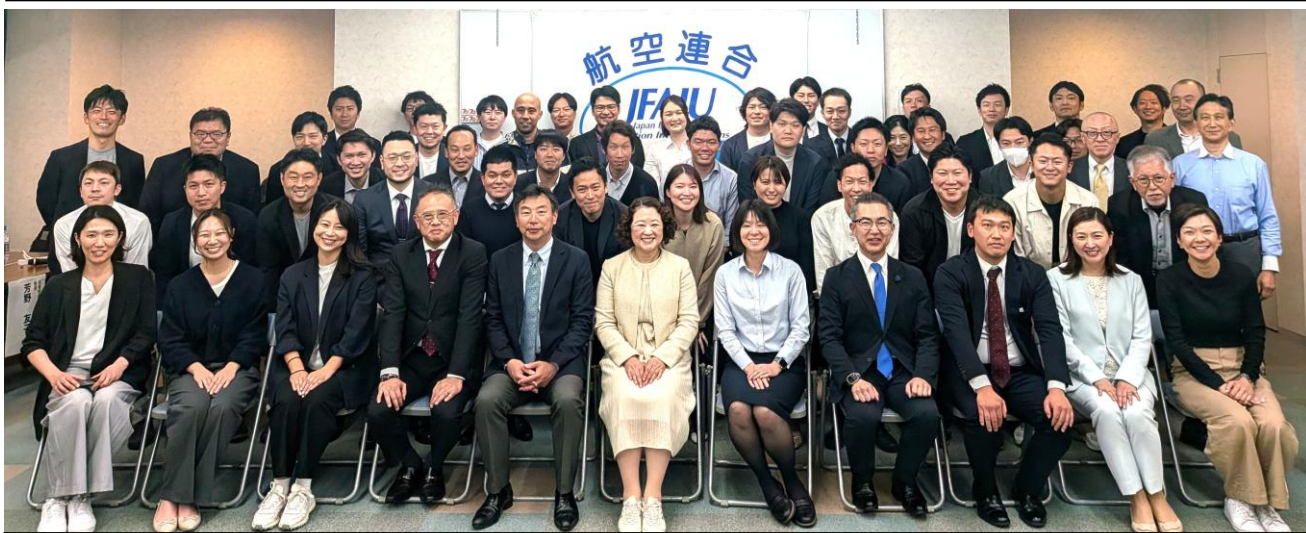
参加者による集合写真