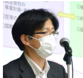
五十嵐 徹人 国土交通省 航空局 航空ネットワーク部長