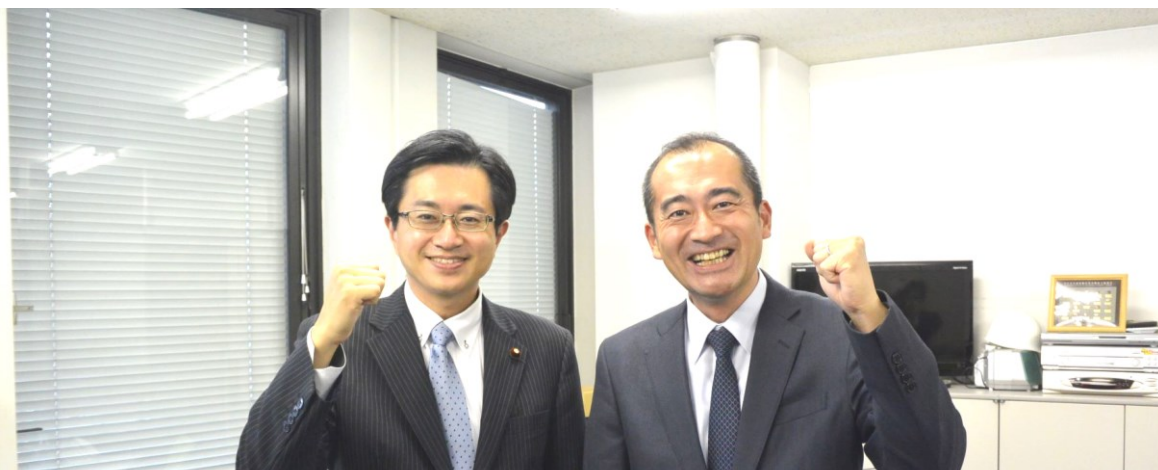
道下大樹 衆議院議員（左）と内藤会長（右） （撮影時のみマスクを外しています）

11月16日（火）、第49回衆議院議員選挙（10月31日投開票）で2回目の当選を果たした道下大樹（みちした だいき）衆議院議員（北海道1区）が、当選の報告と航空連合からの応援に対する謝意を伝えに航空連合本部を来訪しました。